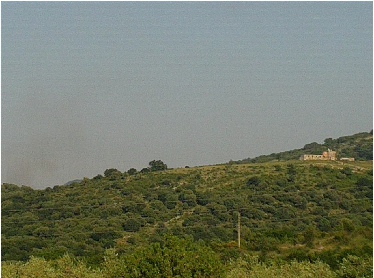
FOTOINSERIMENTO N.7: VISTA DA S-E DELLA VASCA DI ACCUMULO (ZOOM DELLA 6)