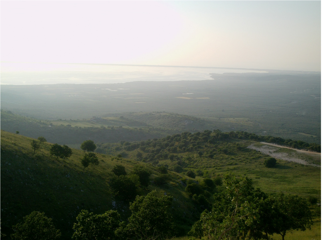
FOTOINSERIMENTO N.8: VISTA DA OVEST DELLA VASCA DI ACCUMULO