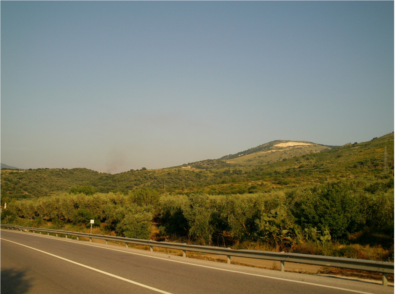
FOTOINSERIMENTO N.6: VISTA DA S-E DELLA VASCA DI ACCUMULO